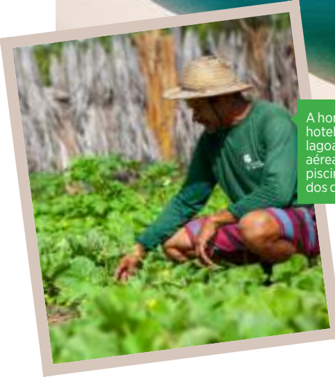
A horta do hotel, uma das lagoas, a foto aérea da piscina e um dos quartos