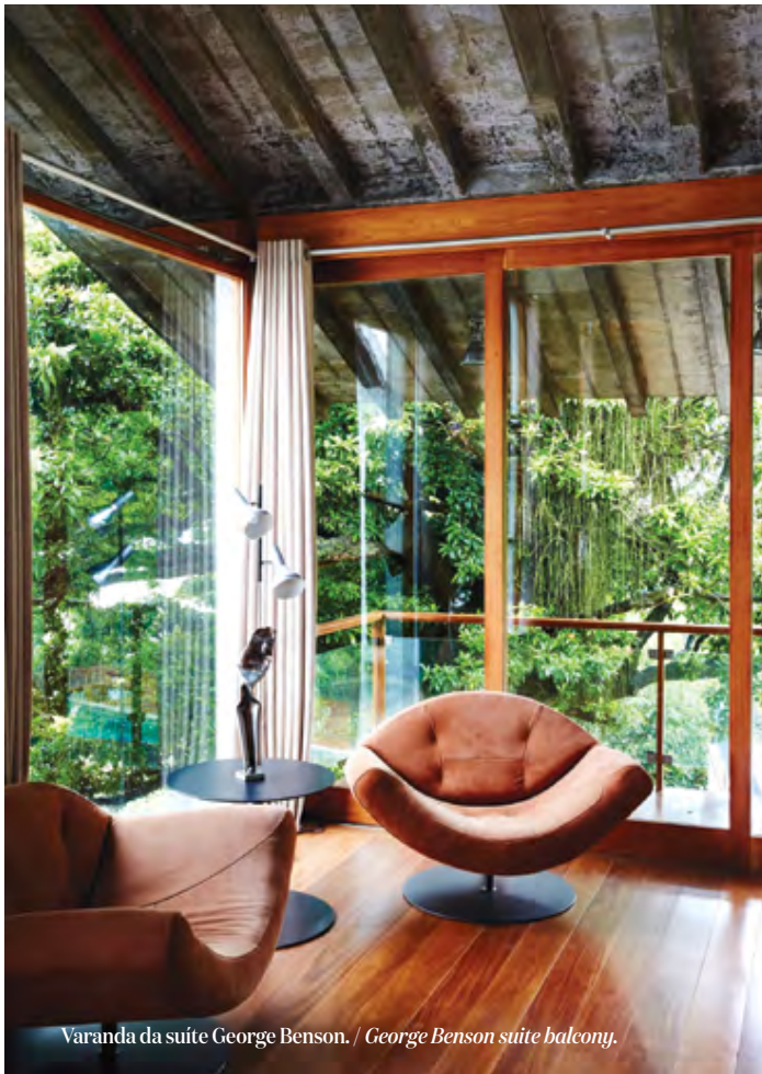
Varanda da suíte George Benson. / George Benson suíte balcony.