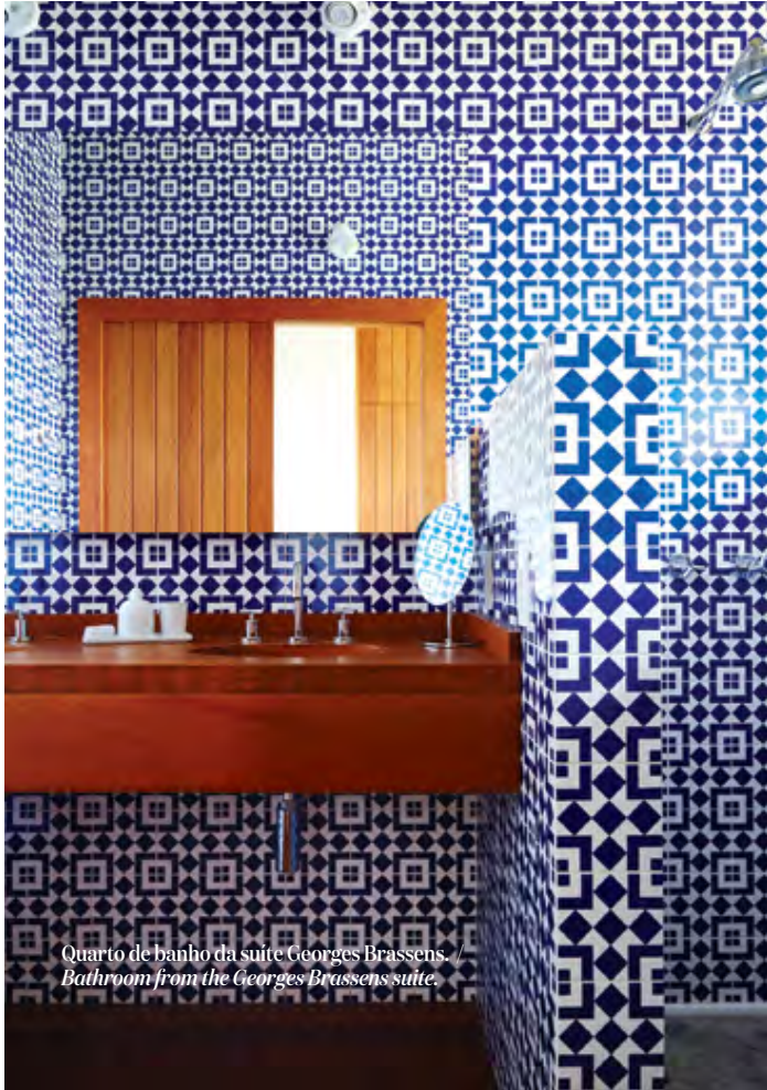
Quarto de banho da suíte Georges Brassens. / Bathroom from the Georges Brassens suíte.