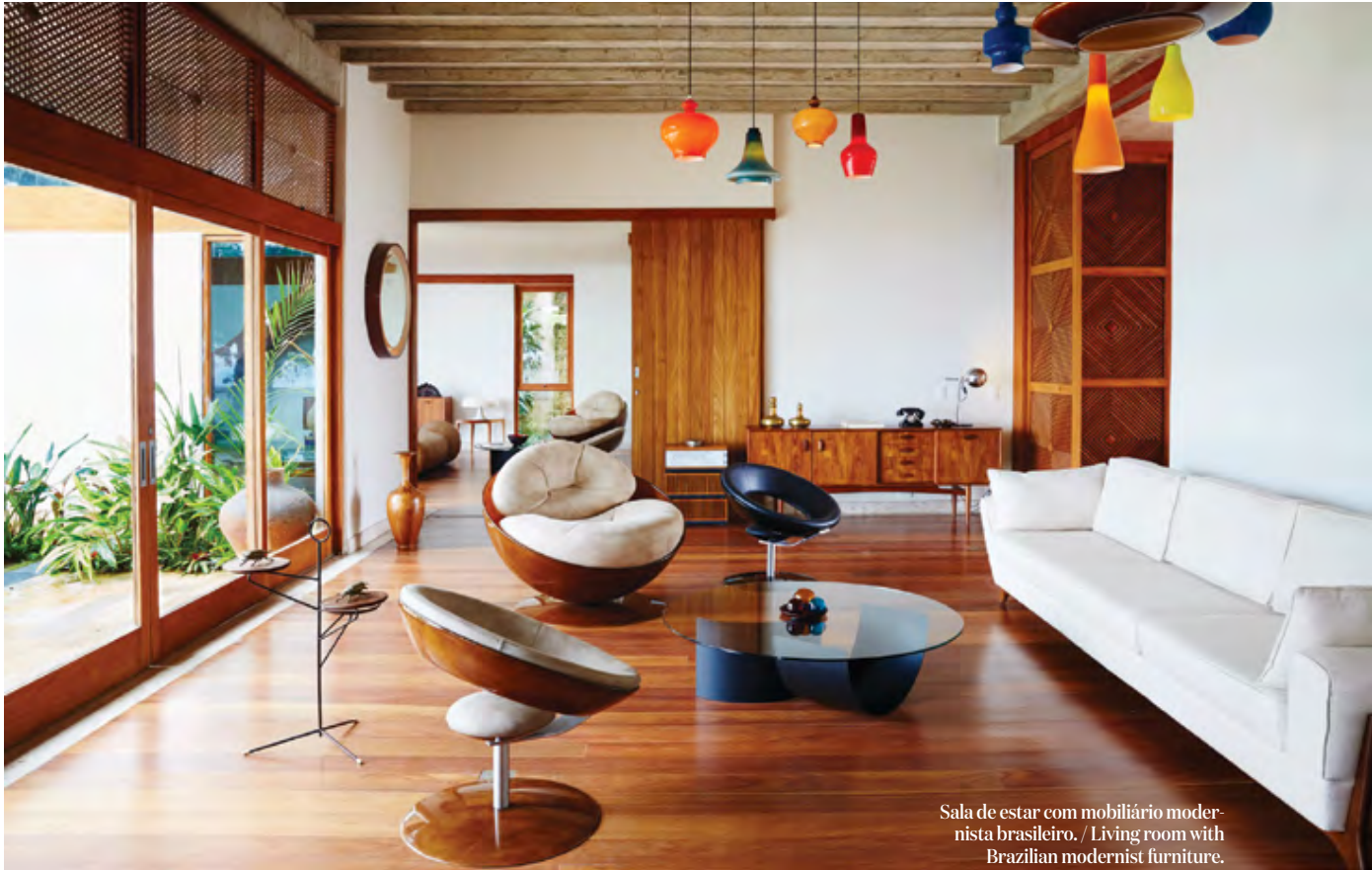
Sala de estar com mobiliário modernista brasileiro. / Living room with Brazilian modernist furniture.