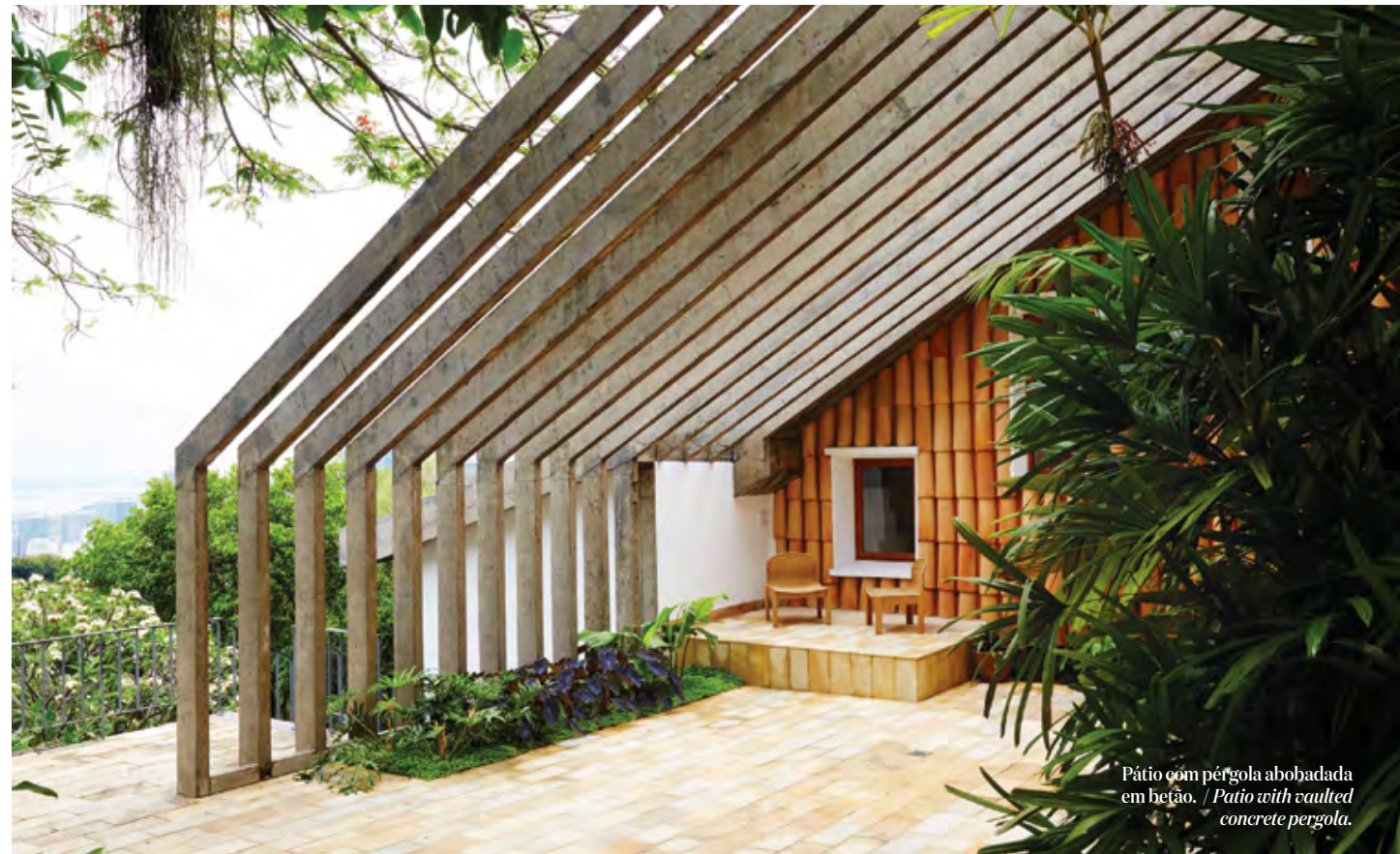
Pátio com pérgola abobadada em betão. / Patio with vaulted concrete pergola.