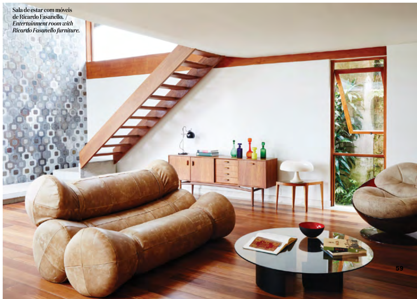
Sala de estar com móveis de Ricardo Fasanello. / Entertainment room with Ricardo Fasanello furniture.