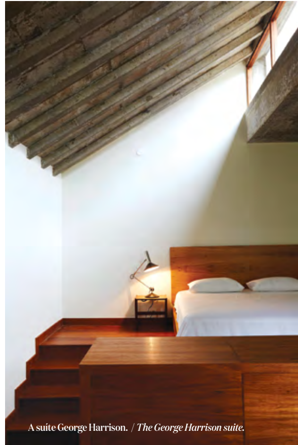
A suíte George Harrison. / The George Harrison suíte.